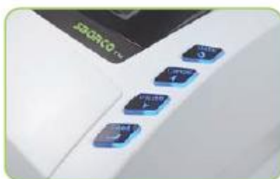
多功能按鍵 + 閃燈警示