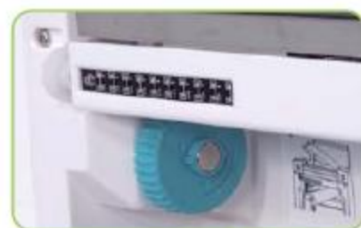
排列式穿透感應器 (自動感測)