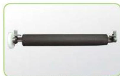
易拆換的滾輪模組設計